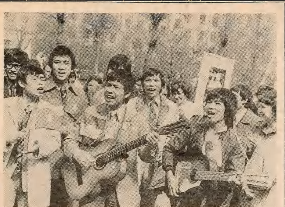
Гэтая вестка першалайскім ранкам абляцела усю зямлю: сіль вызвалення уваінілі у Сайгон, Паўднёвае Гімалаіскае адміністрацыя апускаецца аб стывенна суарэццельня. А яшчэ праз некалькі адзін было аб'яўлена аб поўным вызваленні Сайгона. Гэтая дня доўга гады чакаў у Гімалаіскім народ. Чакаў і змагаўся за тое, каб ён надышоў — доўгачаканы дзень перамогі. В'етнамскія студэнты, якія навуваюцца у БДУ, радасна адзначаюць свой дзень перамогі.