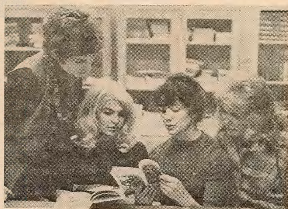
Важную ролю ў падрыхтоўцы будучых журналістаў адыгрывае кафедра стылістыкі і літаратурнага рэдагавання. У яе кабінце шмат спецыяльнай і метадычнай літаратуры, якая дапамагае падрыхтавацца да практычных заняткаў. НА ЗДЫМКУ: першакурснікі журфака знаёмца на кафедрі з навінкамі літаратуры.

Накіроўваючы работу студэнтаў, куратару, аднак, не трэба падаўляць самастойнасць, ініцыятыву студэнтаў. Наадварот, гэтыя якасці патрэбна развіваць і ўлічваць пры складанні плана работы групы. Многія мерапрыемствы студэнтаў могуць арганізаваць і правесці зусім самастойна. Л. ІСАЧАНКАВА, ст. выкладчык кафедры агутнай фізікі.